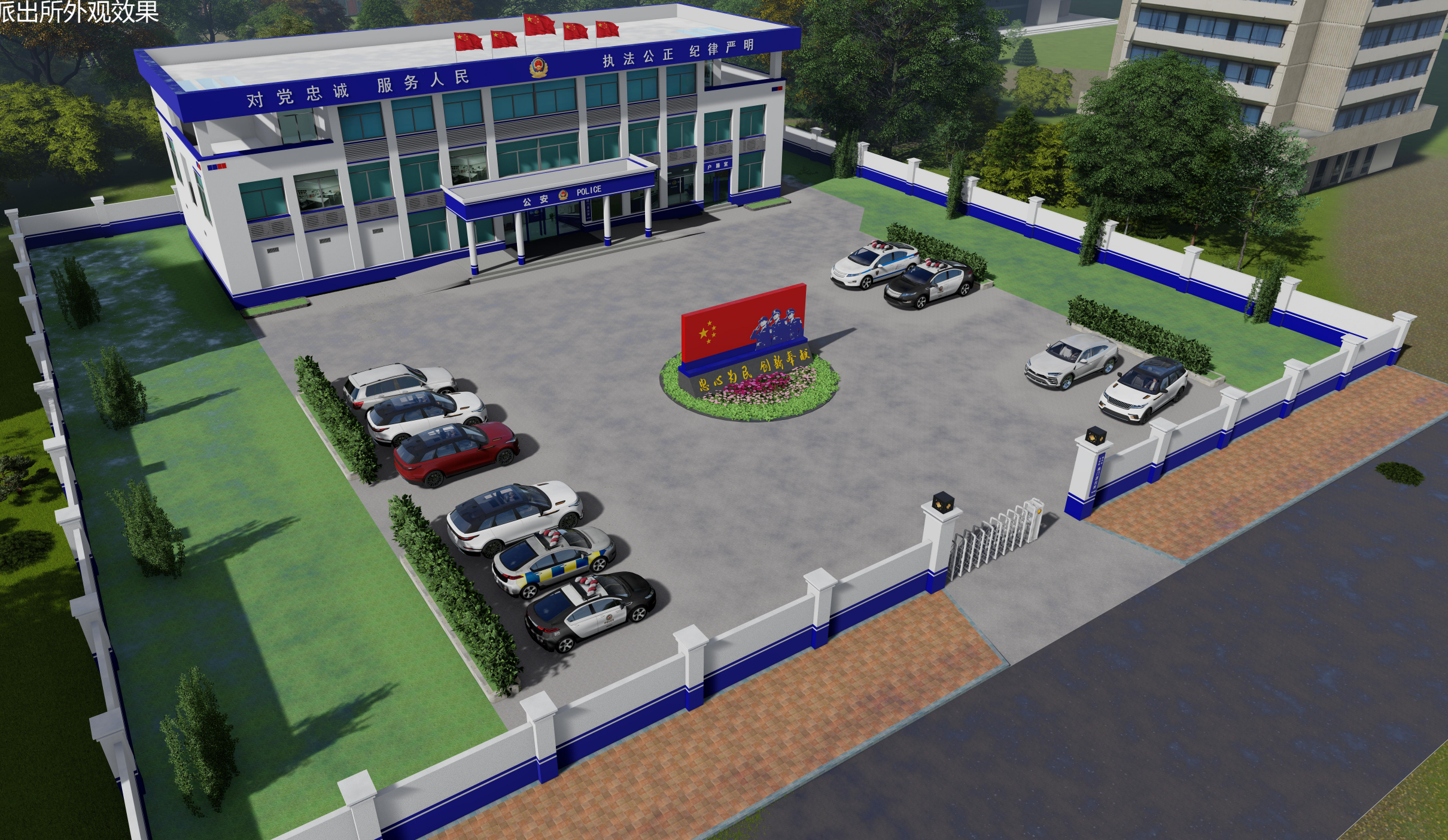
南门派出所外观效果