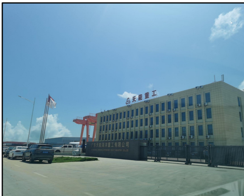
① 陆丰市罗湖西路工业园区